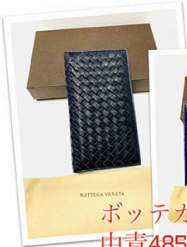
ボッテガ長財布 中青48500円