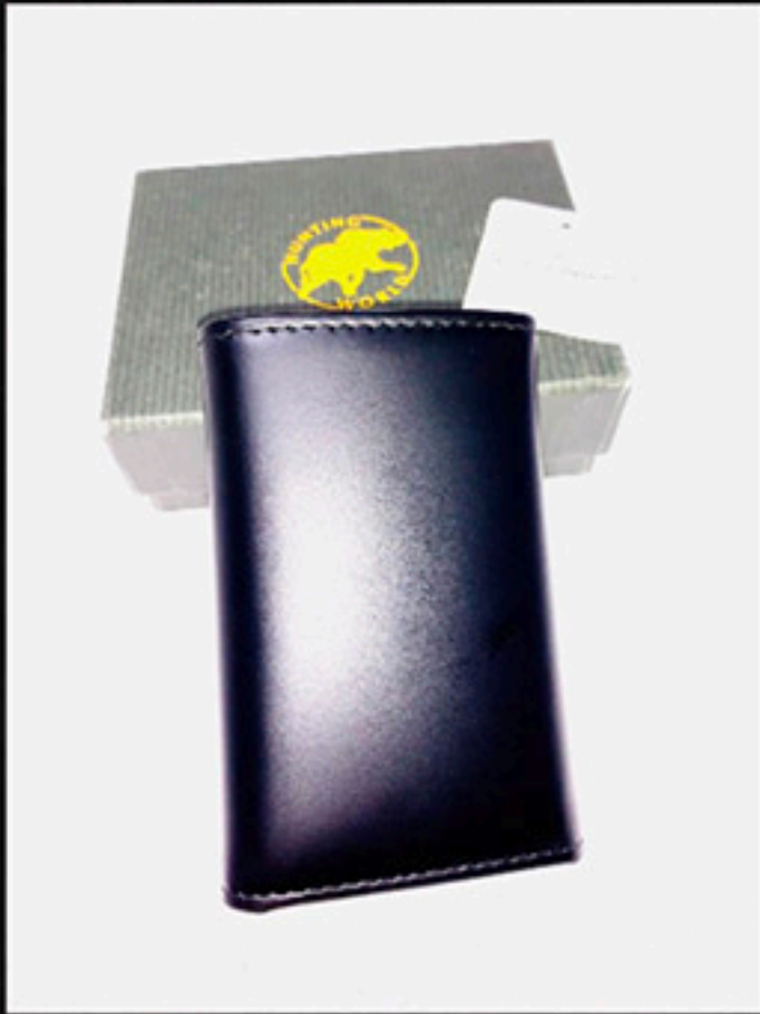
ハンティング ワールド キーケース