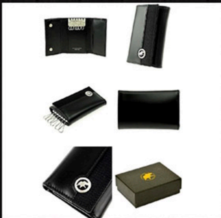
ネット参考価格 15,800円