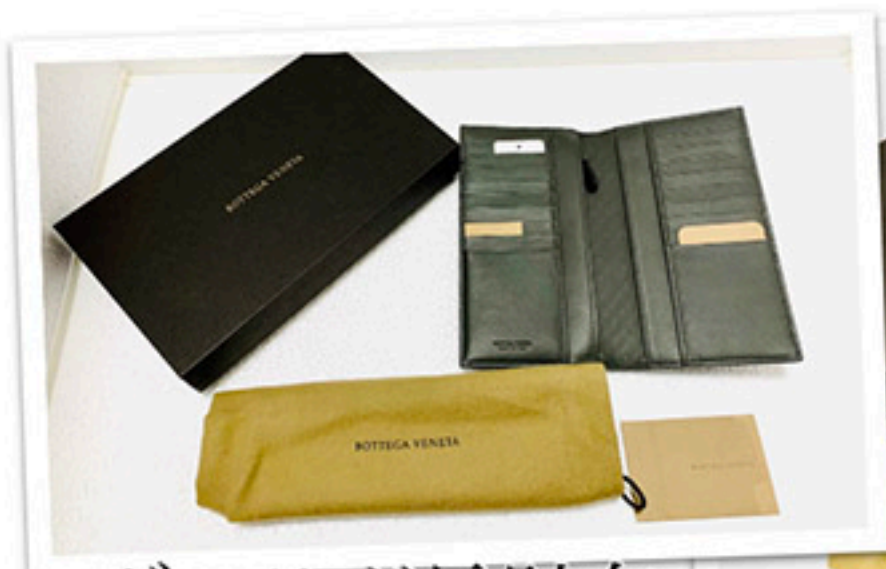
ボッテガ長財布 中黒48500円