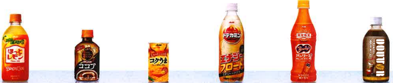
「ほっとレモン」 「パンホーテンココア」 「アサヒ コクうま コーンポタージュ」(再発売) 「ドデカミン」エナジーフロート 「パヤリス」オレンジクラシック 「ドトール」カフェ・オ・レ(自然切替)