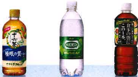
「アサヒ 十六茶プラス」やすらぎブレンド 「ウィルキンソン タンサン」マスカット 「アサヒ 食事の脂にこの1本./1杯.」緑茶ブレンド(自然切替)