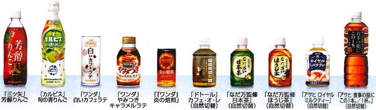
「ミツ矢」芳醇りんご 「カルピス」旬の青りんご 「ワンダ」白いカフェラテ 「ワンダ」やみつぎキャラメルラテ 「ワンダ」炎の焙煎 「ドトール」カフェ・オ・レ(自然切替) 「なだ万監修」日本茶(自然切替) 「なだ万監修」ほうじ茶(自然切替) 「アサヒ ロイヤル」ミルクティー(自然切替) 「アサヒ 食事の脂にこの1本./1杯.」(自然切替)