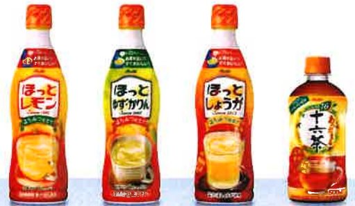
「ほっとレモン」(希釈用) 「ほっと ゆず・かりん」(希釈用) 「ほっとしょうが」(希釈用) 「アサヒ あったまる 十六茶」