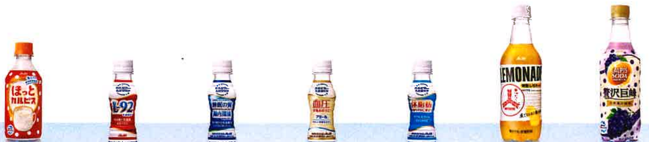
「ほっとカルピス」 「守る働く乳酸菌」 「届く強さの乳酸菌 W(ダブル)」 「アミール」やさしい発酵乳仕立て 「ラクトスマート」 「ミツ矢」特製レモネード 「カルピスソーダ」賢沢巨峰